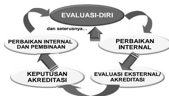
Bagan 1. Daur Penjaminan Mutu dalam Rangka Akreditasi

Seperti dikemukakan terdahulu, evaluasi-diri merupakan salah satu aspek penting dalam keseluruhan daur akreditasi dengan berbagai peran dan kegunaannya, termasuk penjaminan mutu ( quality assurance ). Keseluruhan daur penjaminan mutu dalam rangka akreditasi program studi/ perguruan tinggi itu dilukiskan dalam Bagan 1.